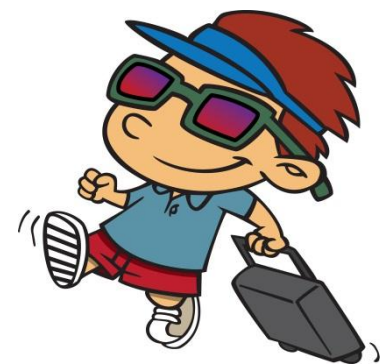
ΟΤΑΝ ΚΑΠΟΙΟΣ ΕΠΙΣΤΡΕΦΕΙ ΑΠΟ ΤΑΞΙΔΙ