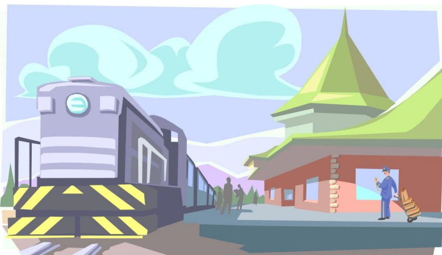
ΟΤΑΝ ΚΑΠΟΙΟΣ ΦΕΥΓΕΙ ΤΑΞΙΔΙ