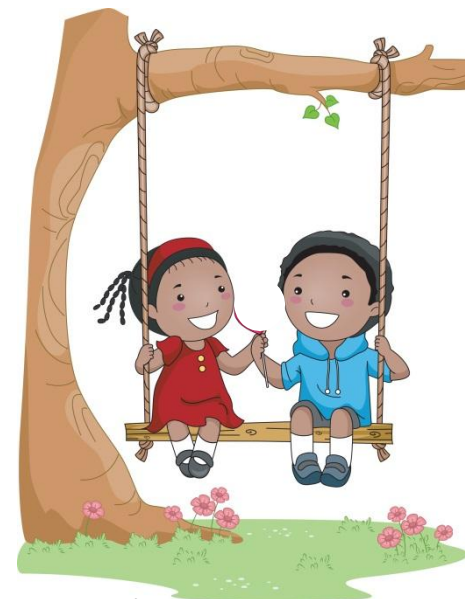
ΟΤΑΝ ΒΛΕΠΟΥΜΕ ΤΟ ΦΙΛΟ ΜΑΣ