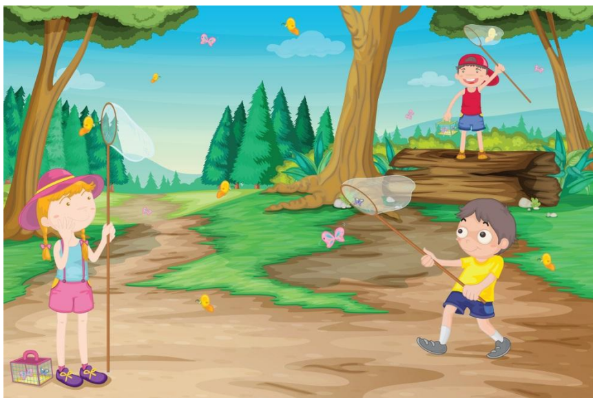
ΣΤΗΝ ΠΑΙΔΙΚΗ ΧΑΡΑ ΜΕ ΤΟΥΣ ΦΙΛΟΥΣ ΜΑΣ www.KindyKids.gr