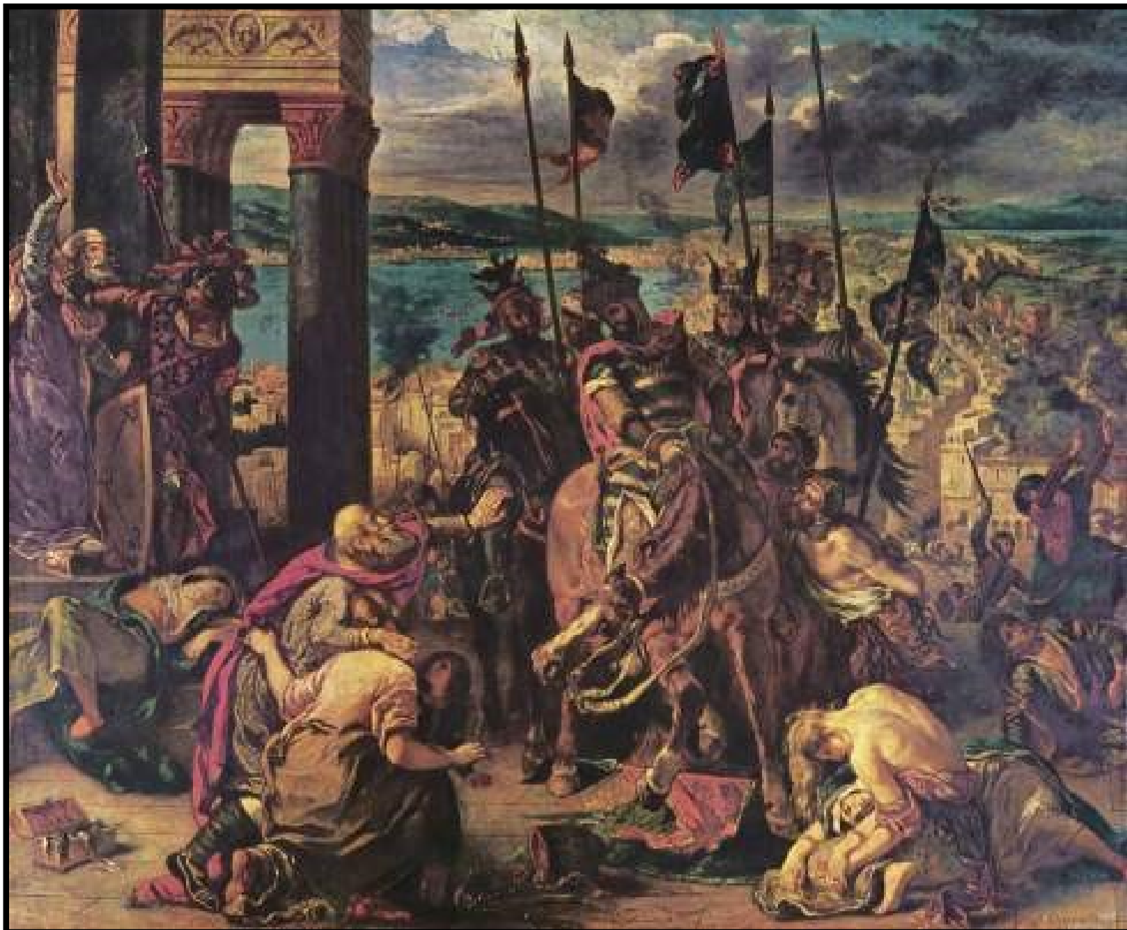
Η άλωση της Κωνσταντινούπολης