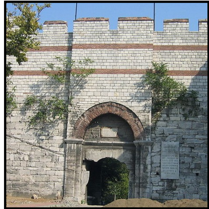
Η Πύλη από την οποία μπήκαν οι Τούρκοι στην Κωνσταντινούπολη