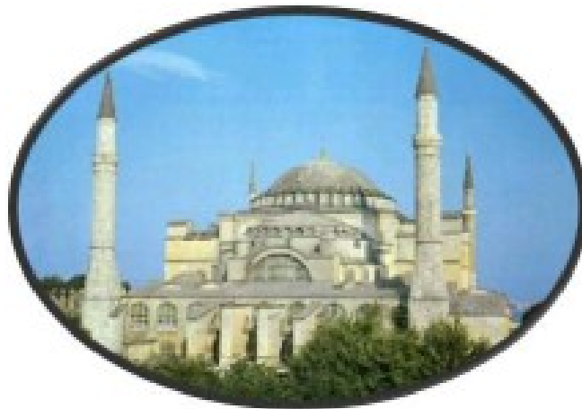
Η Αγία Σοφία